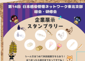
秋田銘菓プレゼント