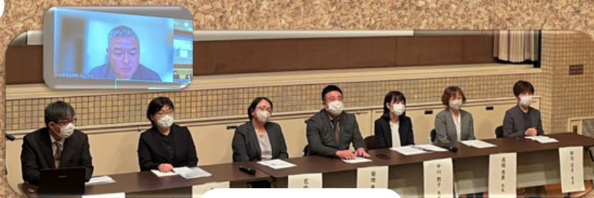
意見交換・質疑応答